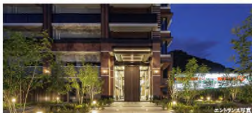
エントランス写真