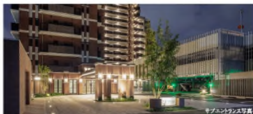
サブエントランス写真