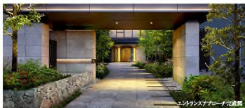
エントランスアプローチ完成図