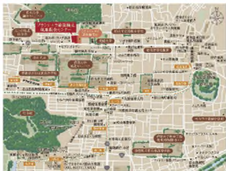
伊予鉄道城北線「赤十字病院前」駅 徒歩8分