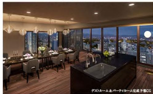
ゲストルームとバータイムム完成予想CG

山陽本線「岡山」駅 徒歩17分(西側エントランスより) 岡山電軌東山線「県庁通り」駅 徒歩3分(東側エントランスより)