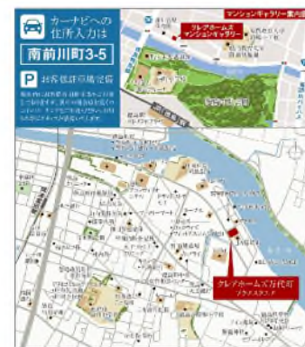
JR牟岐線「阿波富田」駅 徒歩18分