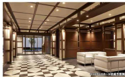
エントランスホール完成予想図