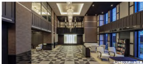
エントランスホール完成予想図