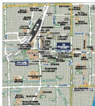
JR山陽本線「岡山」駅 徒歩9分